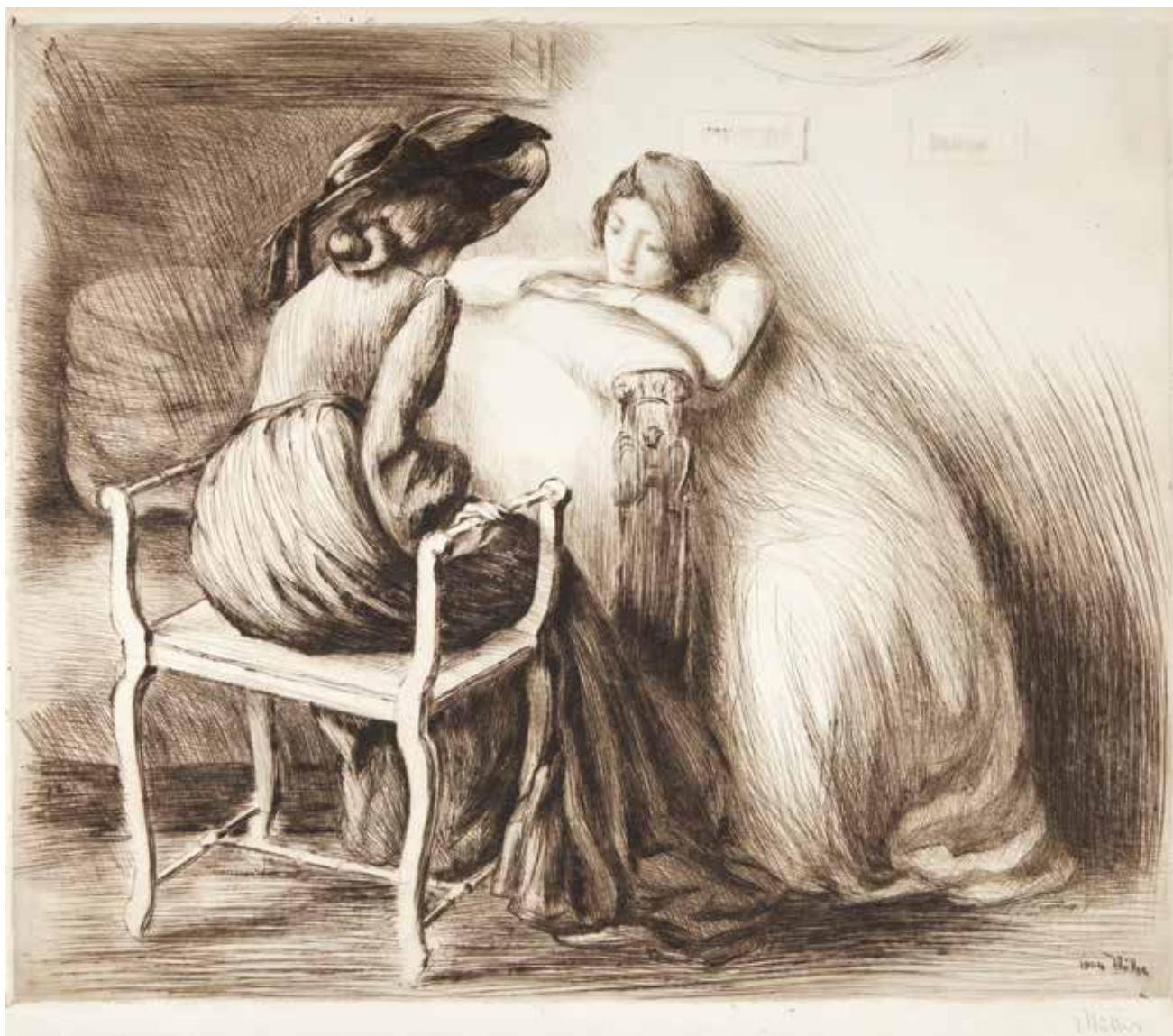
20 • Les Confidences . 1904. Puntasecca in nero mm. 490x590. Foglio mm. 550x695. Firmata e datata sulla lastra e a matita b. d. Edita da Edmond Sagot. Tirata dall'artista in 50 esemplari, dopo qualche prova d'essai e a colori. Catalogo ragionato, 2014, n. E173.