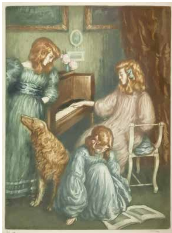
21 • Fillettes au piano (Trois fillettes). 1905. Acquaforte e acquatinta a colori mm. 575x425. Foglio mm. 630x485. Numerata e firmata a matita in basso ai lati: "n. 12 - Müller". Edita da Pierrefort. Catalogo ragionato, 2014, n. E187a.