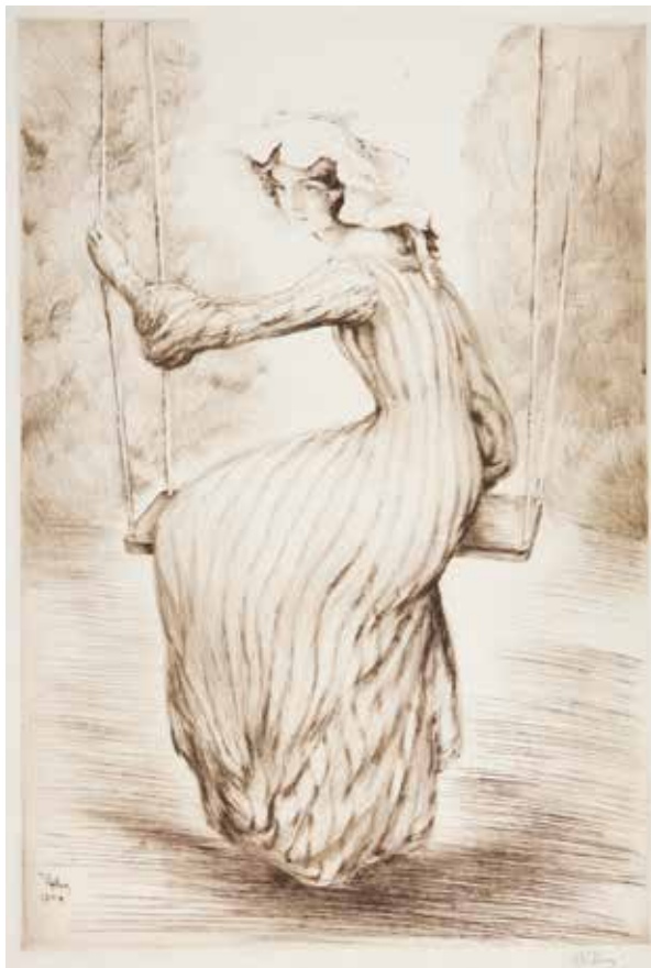
19 • L'Escarpolette . 1904. Puntasecca in nero mm. 650x450. Foglio mm. 730x550. Firmata e datata sulla lastra b. s. Firmata a matita b. d. Edita da Edmond Sagot. Tirata dall'artista in 50 esemplari in nero e 50 a colori. Catalogo ragionato, 2014, n. E172.