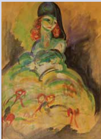
Colombina. Tempera verniciata su cartone mm. 300x235. Bozzetto legato al dipinto Il laberinto . 1918.

24 • Sei bozzetti legati alla serie delle "Arlecchinate". Ante 1918.