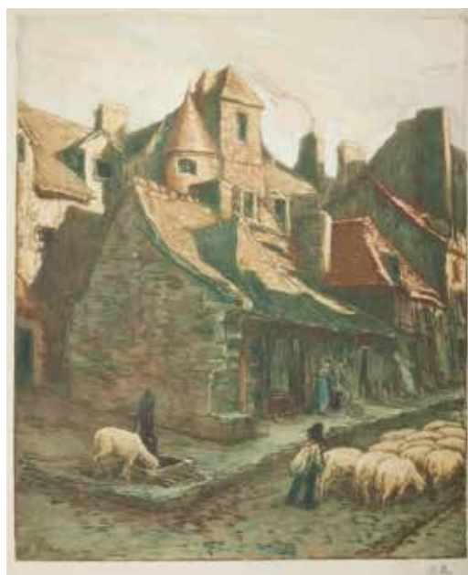
23 • Vieilles maisons. Alençon (prima versione) o Les Vieux Toits. 1905. Acquaforte e acquatinta mm. 550x450. Foglio mm. 720x550. Firmata sulla lastra b. s. e a matita b. d. Annotata a matita b. d.: "N. 38 Le village". Tirata dell'artista in 50 esemplari. Catalogo ragionato, 2014, n. E205.