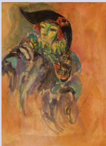
Arlecchino (2). Tempera verniciata su cartone mm. 300x245. Bozzetto legato al dipinto Il laberinto . 1918.

Maschera con tricorno. Tempera verniciata su cartone mm. 295x245.