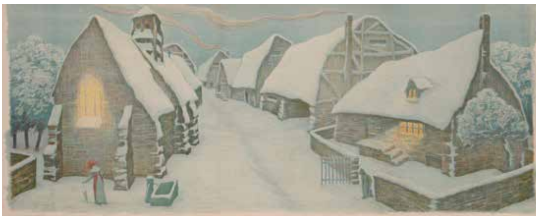
17 • Le Village en hiver (La Neige) . 1903. Litografia a colori mm. 600x1480. Da una serie di 6 pannelli decorativi editi da Edmond Sagot ( Frises Müller ). Catalogo ragionato, 2014, n. E158.