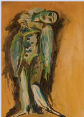
Pierrot. Tempera verniciata su cartone mm. 295x245. Firmato a matita in b. al centro. Bozzetto legato al dipinto La rosa di sangue . 1918.

Arlecchino. Tempera verniciata su cartone mm. 300x240. Bozzetto legato al dipinto La dichiarazione . 1918.