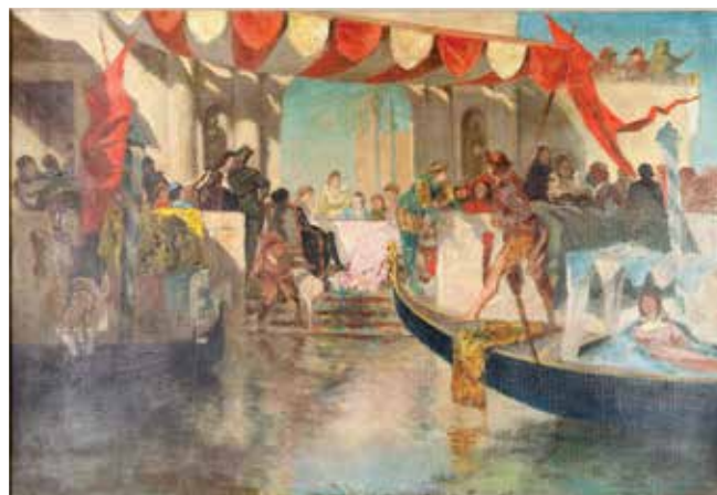
27 • Scena veneziana . 1915 ca. Olio su tela cm. 27x40,5. Iscritto al retro del telaio Alfredo Müller”.